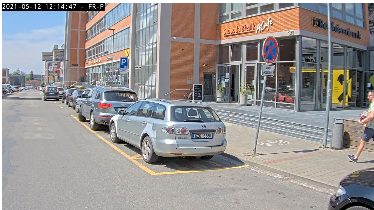
ul. J. A. Bati (u pošty) – parkování v zákazu zastavení (v prostoru pro vozidla zásobování) a parkování v druhé řadě