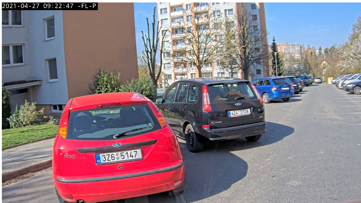
ul. Budovatelská – šikmé parkování u krajnice ulice s obousměrným provozem, průjezdná šířka neumožňuje vyhnutí dvou protijedoucích vozidel