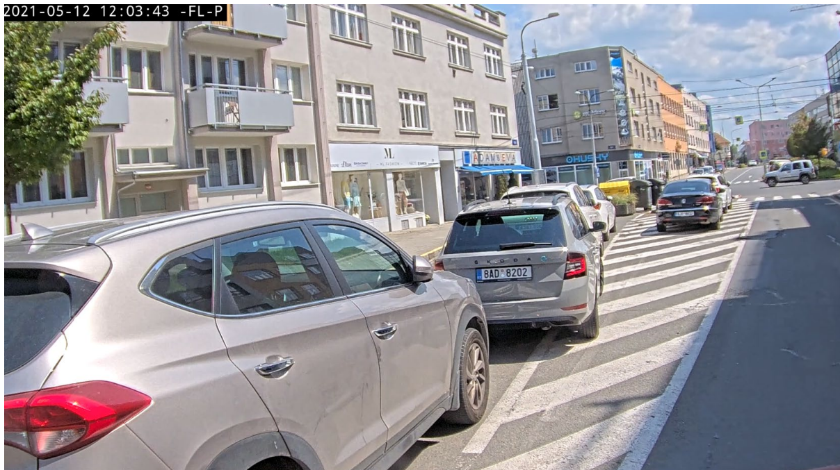
ul. Zarámí – vozidla zaparkovaná v dopravním stínu