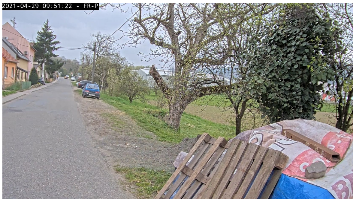
ul. Pod Vinohrady – parkování na soukromém pozemku bez zásahu do prostoru místní komunikace