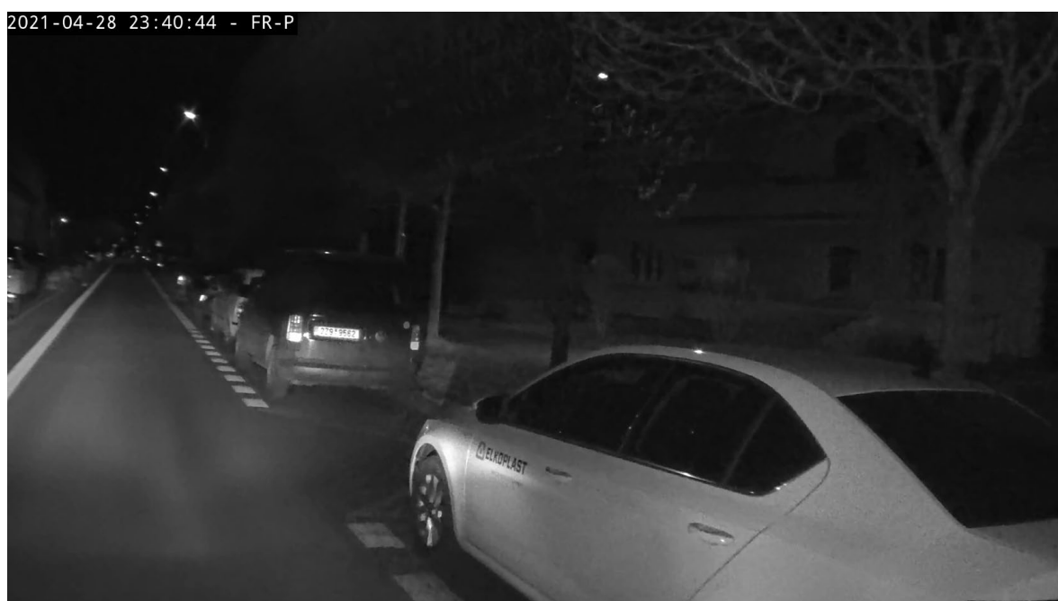
ul. Tyršova – plně obsazené podélné parkoviště včetně správně uvolněného prostoru vyznačeného žlutou klikatou čarou