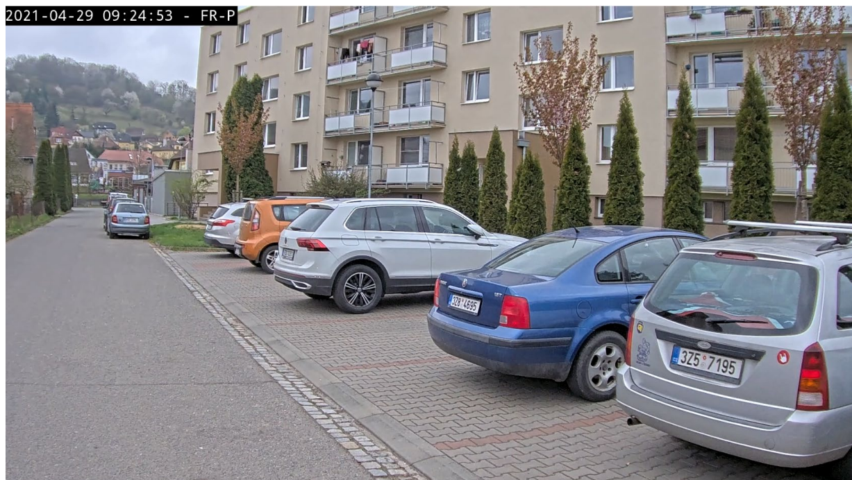
ul. Pod Mlýnem – několik volných parkovacích míst a pozůstatek z nočního nelegálního podélného stání