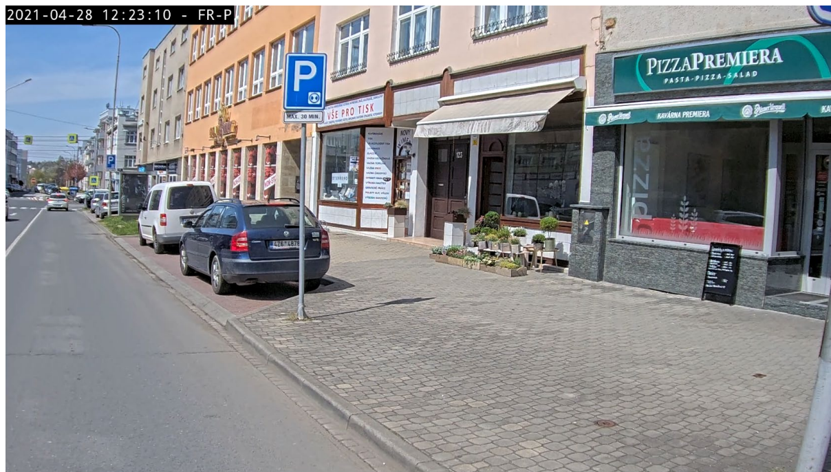
ul. Kvítková – plně obsazené časově omezené parkoviště